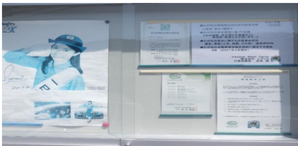
<エコアクション掲示板>