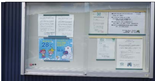
<エコアクション掲示板>